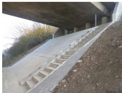
Aménagement de perré