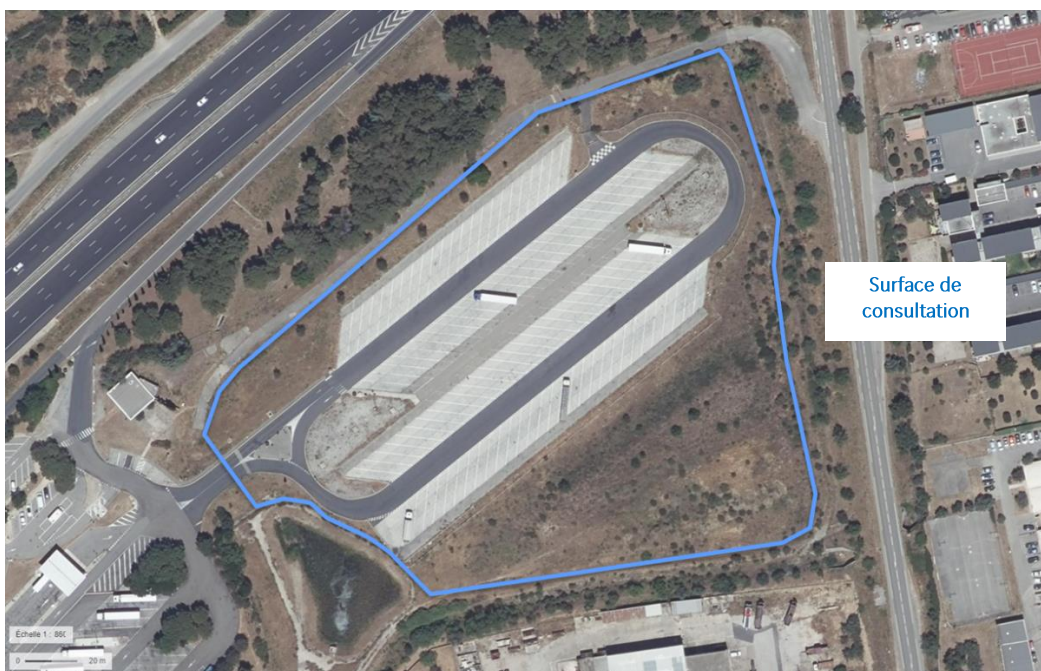
Emplacement envisagé pour l'installation et l'exploitation d'ombrières photovoltaïques

Située sur l'A9, au point kilométrique n°45, dans le sens Le Perthus - Orange, l'aire de Marguerittes Sud comprend sur l'ensemble de sa surface 137 places VL, 3 places dédiées aux VLR et 153 places PL.