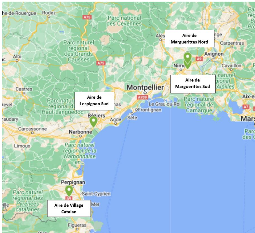
Localisation des sites