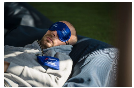
Espace Sieste Fondation VINCI Autoroutes

Ce vendredi 5 juillet marquera l'ouverture officielle de la saison estivale, avec le début des vacances scolaires. Comme l'a récemment rappelé une enquête réalisée par l'Ifop 1 , c'est en voiture que les trois quarts des Français qui ont la chance de partir en vacances voyageront cet été. Les jours de forts trafics, jusqu'à 4 millions de voyageurs par jour emprunteront ainsi le réseau VINCI Autoroutes. Tout au long de leurs trajets, ils pourront profiter de l'accueil et des nombreuses animations proposées par les équipes de VINCI Autoroutes et de leurs partenaires, afin de se détendre et faire des pauses réparatrices. Sur une quinzaine d'aires du réseau 2 , les vacanciers pourront ainsi retrouver, dans le cadre des Etapas #BienArriver , déployées les samedis et, selon les aires, les vendredis : des initiations à toutes sortes de disciplines sportives, des espaces conviviaux pour pique-niquer et/ou changer bébé, des électro-équipiers reconnaissables à leur gilet bleu... ainsi que des espaces de la Fondation VINCI Autoroutes regroupant, sur 10 aires 3 , une zone sieste, un stand prévention et une bibliothèque à ciel ouvert !