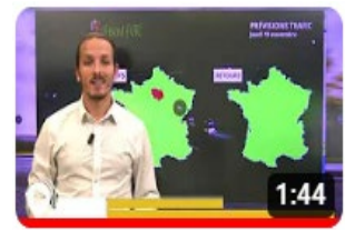
Info trafic en vidéo

A partir du 3 juillet, Radio VINCI Autoroutes publiera chaque mercredi à 16h une vidéo présentant les prévisions trafic pour le week-end à venir. Diffusé sur sa chaîne YouTube , cette vidéo sera reprise sur le site et le fil Twitter de VINCI Autoroutes. Sur ce même fil, chaque samedi des points info trafic en vidéo seront publiés régulièrement publiés, en complément des cartes de temps de parcours constatés sur les différents axes du réseau.