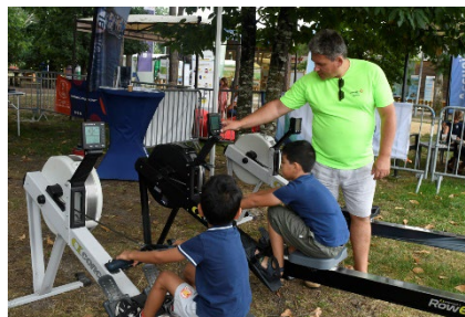
Aire de Romorantin/A85