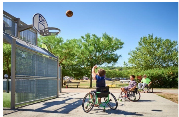
Découverte du handibasket, Port Lauragais/A61