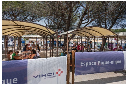
Espace pique-nique, Lançon-de-Provence/A7