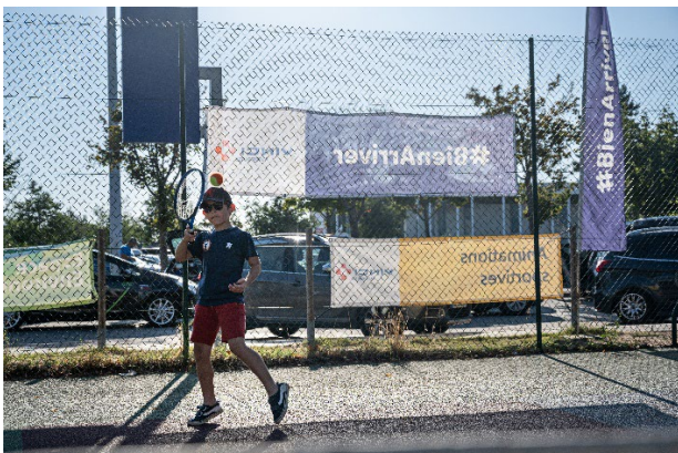
Initiation au tennis, Saint-Rambert/A7

Incontournables et plébiscitées par les vacanciers, l'invitation à la détente et l'initiation à des activités sportives sont aussi au rendez-vous sur les Espaces #BienArriver. Sur les espaces Détente, des coussins géants et des transats sont en libre accès pour reposer ses yeux, laisser son esprit vagabonder, faire le vide... avant de reprendre la route rasséréiné. Les plus actifs, prêts à se dépenser, comme les plus curieux, toujours à la recherche de nouvelles activités, pourront profiter des animations sportives déployées en plein air, en partenariat avec les Comités départementaux olympiques et sportifs : parcours aventure, tir à l'arc, judo, boxe, escrime... sans oublier les vélos à jus !