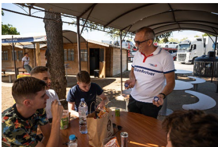
Aire de Saint-Rambert/A7

Chaque week-end, les équipes de VINCI Autoroutes, de la Fondation VINCI Autoroutes et de leurs nombreux partenaires, proposeront des animations originales sur les aires d'autoroutes pour permettre à chacun de se détendre et de récupérer sur la route des vacances