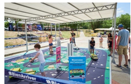
Mini circuit, Villefranche de Lauragais/A61