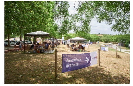
Espace pique-nique, Port Lauragais/A61

Incontournables et plébiscitées par les vacanciers, l'invitation à la détente et l'initiation à des activités sportives sont aussi au rendez-vous sur les Espaces #BienArriver. Sur les espaces Détente, des coussins géants et des transats sont en libre accès pour reposer ses yeux, laisser son esprit vagabonder, faire le vide... avant de reprendre la route rasséréiné. Les plus actifs, prêts à se dépenser, comme les plus curieux, toujours à la recherche de nouvelles activités, pourront profiter des animations sportives déployées en plein air, en partenariat avec les Comités départementaux olympiques et sportifs : parcours aventure, tir à l'arc, judo, boxe, escrime... sans oublier les vélos à jus !