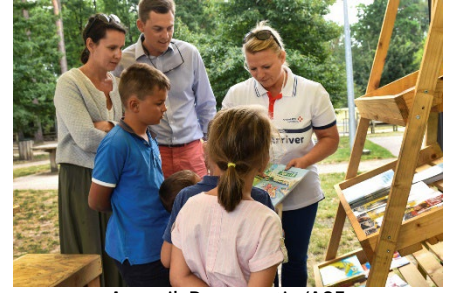
Accueil, Romorantin/A85