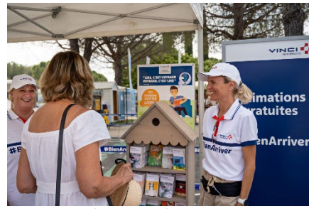
Accueil, Lançon-de-Provence/A7