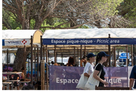
Espace pique-nique, Lançon-de-Provence/A7