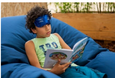
Espace sieste, Limours Janvry/A10

Parce que la somnolence et l'inattention restent l'une des premières causes d'accident sur autoroute, la Fondation VINCI Autoroutes mobilise, cette année encore, ses ambassadeurs pour sensibiliser les conducteurs à l'importance de s'arrêter dès les premiers signes de fatigue. Trois espaces dédiés seront ainsi déployés, autour de la prévention, de la sieste et de la lecture. Trois thèmes forts pour sensibiliser tout un chacun aux bons comportements à adopter sur la route des vacances !