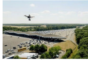
Info trafic par drone