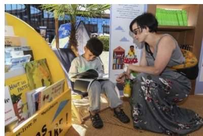
Espace lecture, Limours Janvry/A10