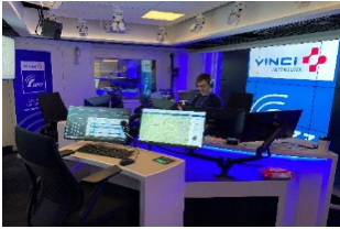
Studio de Radio VINCI Autoroutes