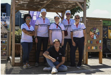
Accueil #BienArriver, Chartres Gasville/A11

Comme chaque année, les vacanciers pourront profiter, les samedis et, selon les aires, les vendredis de juillet et août , de 15 aires #BienArriver , animées par des équipiers VINCI Autoroutes. Des pique-niques à l'ombre, et dans une ambiance conviviale, sur des tables régulièrement nettoyées, aux « cabines bébé » pour permettre aux parents de changer en toute tranquillité, tout est conçu pour une pause sereine et réparatrice.