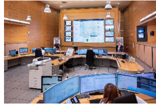
Centre d'Information Trafic © VINCI Autoroutes, DR