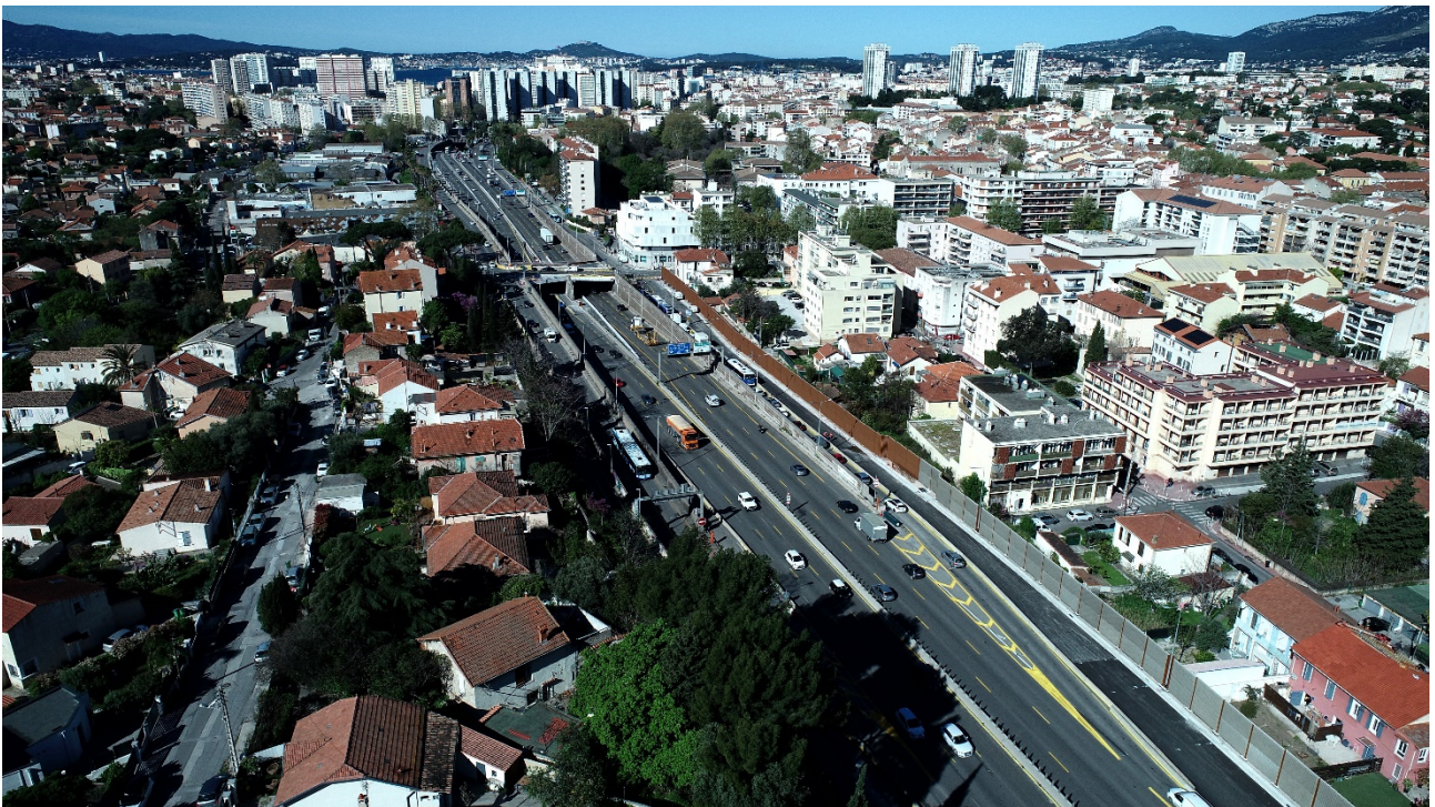
Élargissement A57 – Secteur Benoît Malon © Elite drone - Mars 2024

Toutefois, VINCI Autoroutes réalisera des travaux de maintenance sur les équipements de l'autoroute A50 et du tunnel de Toulon. Ces interventions entraîneront des modifications de circulation, la nuit du jeudi 2 au vendredi 3 mai 2024, entre 21h et 6h.