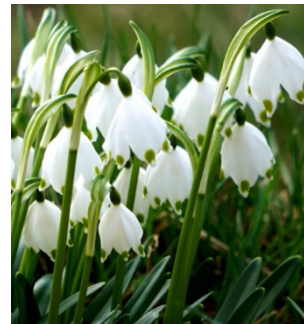
Nivéole de Nice