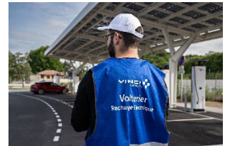
Gilet Bleu sur une aire

Comme lors de chaque période de fort trafic, VINCI Autoroutes renforce son dispositif d'information trafic pendant les vacances de la Toussaint. Que ce soit sur son site Internet, sur X (ex-Twitter) ou sur les 24 bornes digitales installées sur des aires de services, les vacanciers pourront accéder aux prévisions de trafic ainsi qu'aux conditions de circulation en temps réel pour mieux préparer leur trajet.