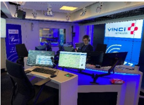
Studio de Radio VINCI Autoroutes