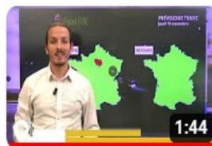
Info trafic en vidéo