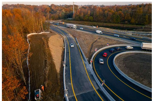
Novembre 2021 – Mise en œuvre des enrobés et mise en circulation de la boucle provisoire pour assurer la liaison entre l'autoroute A11 et la boucle provisoire et permettre le maintien de la circulation pendant toute la durée des travaux.