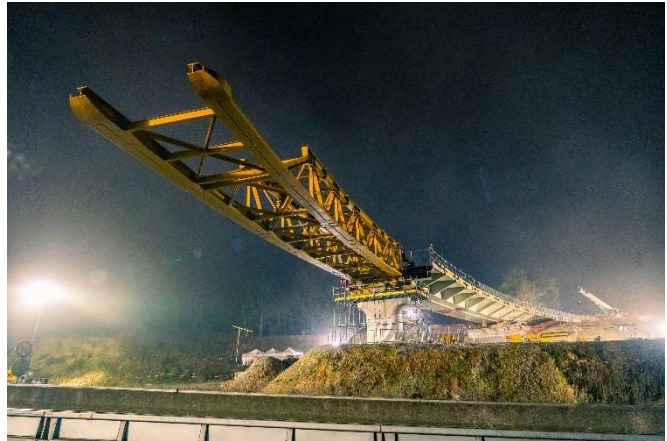
Janvier 2023 – Lançage de la charpente du viaduc ouest. Opération qui s'est déroulée au cours de 3 nuits.