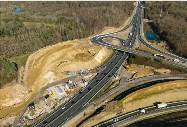
Février 2022 – travaux de terrassement pour poursuivre la construction de la bretelle et construire la plateforme d'assemblage du viaduc ouest.