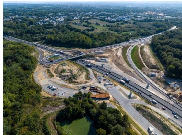
Septembre 2022 – Réalisation de la plateforme d'assemblage pour la construction du viaduc ouest. Cette plateforme constituera également l'assise de la future bretelle d'accès au viaduc.