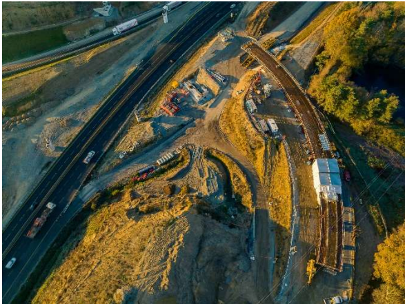
Décembre 2022 – Assemblage et soudage de la charpente du viaduc ouest

Le viaduc ouest est un ouvrage de 120 m de long et de 8,40 m de large qui se distingue des ponts plus classiques par sa courbure et ses dimensions hors norme. Il appartient à la catégorie des ouvrages dits « non-courants » car la travée qui surplombe l'autoroute A11 mesure plus de 40 m de long. Ce viaduc est constitué de 3 travées. Il culmine à 10 m au-dessus de l'autoroute A11.