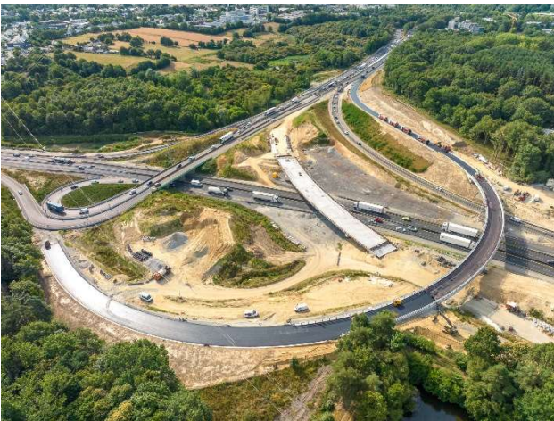
Juillet/Août 2023 – Mise en œuvre des enrobés sur la bretelle et le viaduc ouest. Pose des dispositifs de sécurité avec la mise en place d'un muret en béton le long de la bretelle.