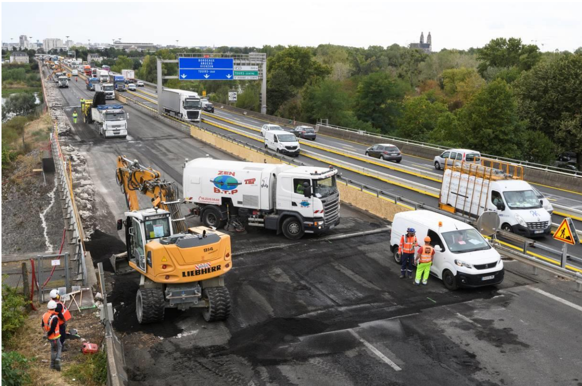
Autoroute A10 dans la traversée de Tours, phase travaux 2019.

VINCI Autoroutes poursuit son programme d'entretien de l'autoroute A10 dans la traversée de Tours, démarré en 2019. Des travaux importants se dérouleront sur 7 semaines du 4 septembre au 20 octobre 2023, entre les échangeurs de Tours centre (n°21) et de Chambray-lès-Tours (n°23). Cette vaste opération consiste à entretenir les viaducs et les ponts qui se trouvent sur cette portion de 4 km : au-dessus des voies ferrées à Saint-Pierre-des-Corps, du Cher, de l'avenue du Lac à Tours et de la rue Charles de Foucauld, à Saint-Avertin. L'objectif de ces travaux est d'assurer la durabilité de ces ouvrages d'art, afin de préserver le confort des usagers et leur environnement.