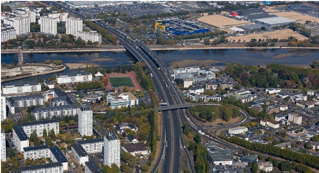
Autoroute A10 dans la traversée de Tours.

VINCI Autoroutes poursuit le programme d'entretien de l'autoroute A10 dans la traversée de Tours, démarré en 2019. Cette nouvelle phase concerne une portion de 6 km, entre les échangeurs de Tours nord (n°19) et de Chambray-lès-Tours (n°23). Après la rénovation des ouvrages d'art - au niveau de la Loire - et des chaussées entre 2019 et 2022, l'année 2023 sera consacrée à d'importants travaux d'entretien des ouvrages de l'A10 au-dessus des voies ferrées à Saint-Pierre-des-Corps, du Cher, de l'avenue du Lac et de la rue Charles de Foucault à Saint-Avertin. L'objectif de ces travaux est d'assurer la durabilité de ces viaducs et ponts, afin de préserver le confort des usagers et leur environnement. Après une phase préparatoire prévue cet été, des travaux plus importants se dérouleront sur 7 semaines entre les mois de septembre et d'octobre, entre les échangeurs de Tours centre (n°21) et de Chambray-lès-Tours (n°23).