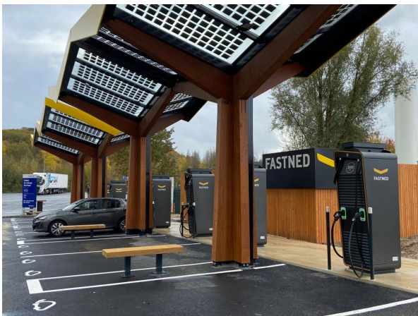
Station Fastned sur aire de Manoire, A89

Dans le cadre de ses engagements pour accompagner le développement des mobilités décarbonées, VINCI Autoroutes poursuit le déploiement continu de stations de recharge électrique sur son réseau. Fastned met ainsi en service en cette fin d'année 4 nouvelles stations sur les aires d'Ambrussum Nord (A9, dans le Gard), Jardin Causses du Lot (A20, dans le Lot), de Manoire (A89, en Dordogne) et de Plaine du Forez Est (A72, en Loire). Au total, ce sont d'ores et déjà 32 points de recharge rapide, d'une puissance maximale de 300 kW, qui sont à la disposition des électromobilistes empruntant le réseau VINCI Autoroutes, leur permettant de recharger jusqu'à 300 km d'autonomie en 20 minutes.