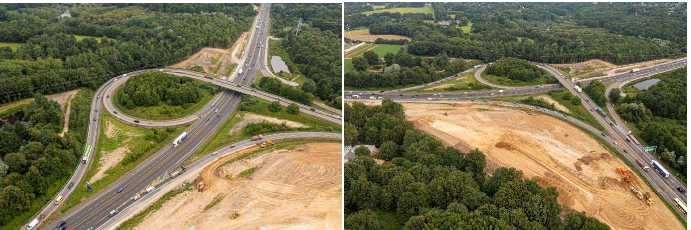
Porte de Gesvres (n°38) en juillet 2021.