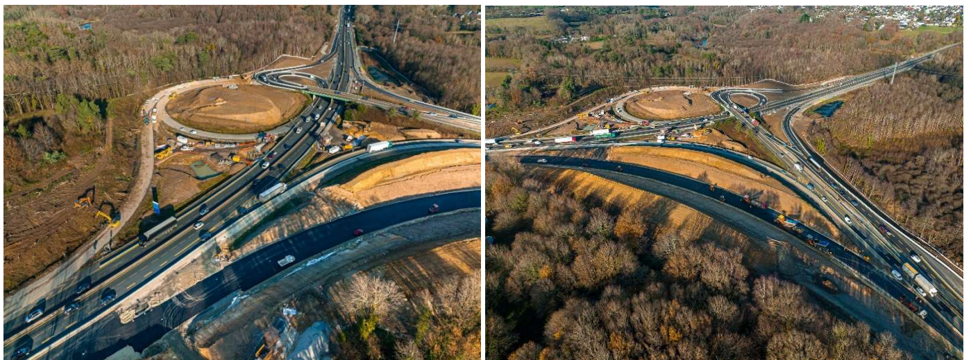
Porte de Gesvres (n°38) en décembre 2021.