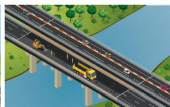
Dépose de l'étanchéité existante