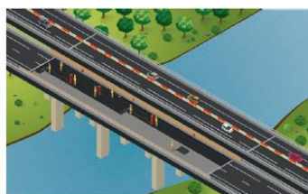
Pose de la nouvelle étanchéité