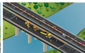
Réfection de la couche de roulement