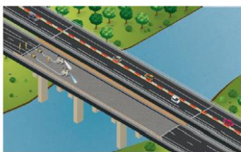
Préparation de la surface de la dalle béton