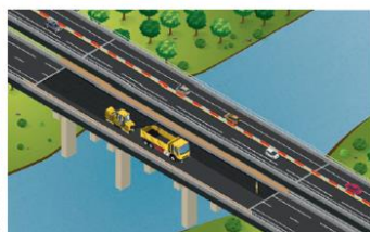
Rabotage de la surface