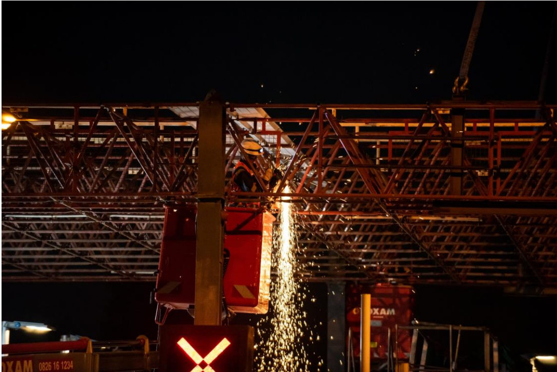
Les équipes retirent les feux d'affectation et allègent l'auvent