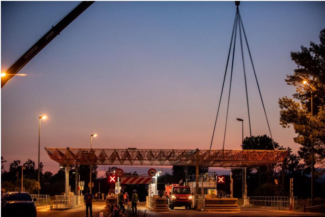
La grue de 200 tonnes retire la première partie de l'auvent