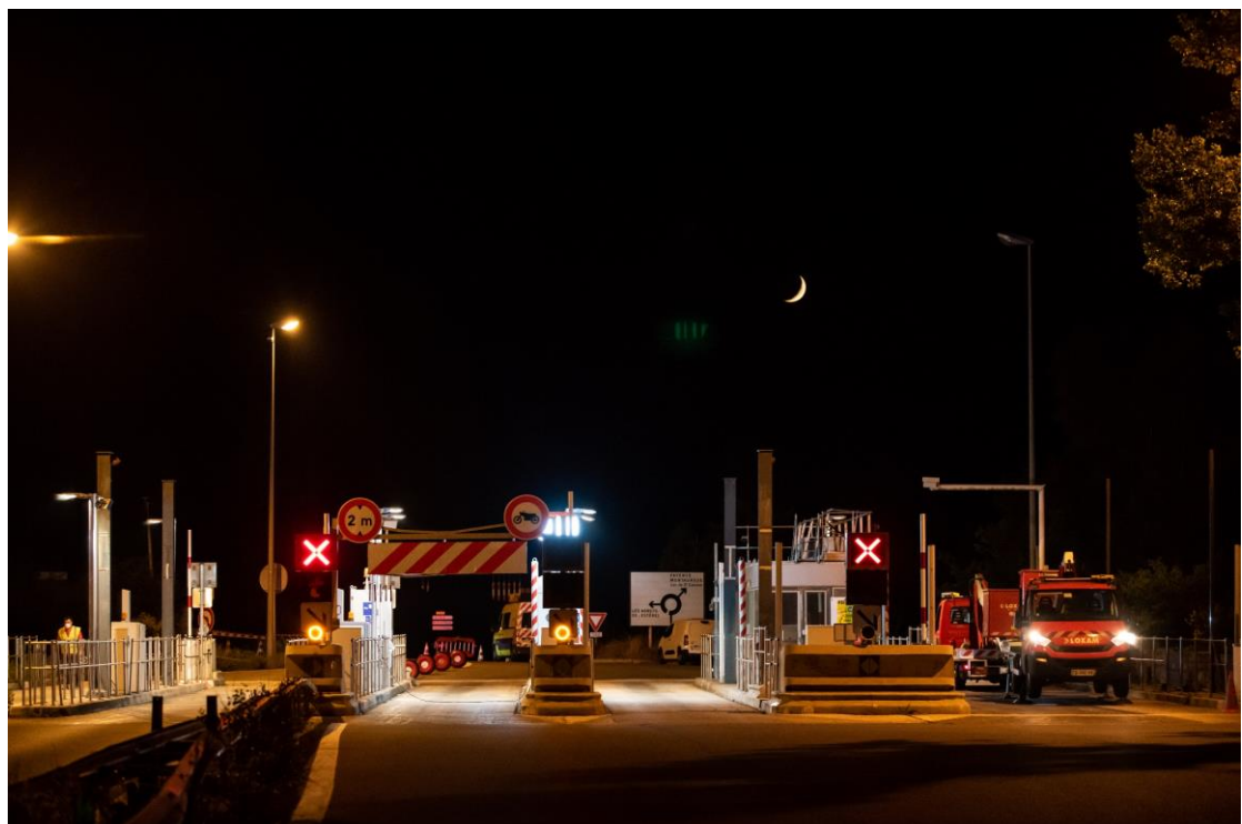
La gare de péage des Adrets (n°39) sans son auvent