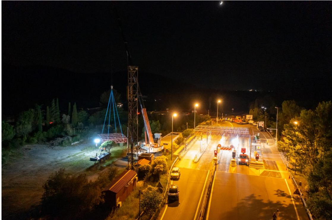
La grue pose l'ancien auvent à côté de la gare de péage où il sera ensuite démantelé