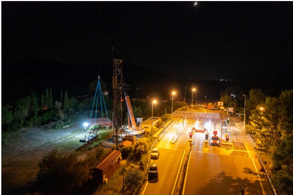
La grue pose l'ancien auvent à côté de la gare de péage où il sera ensuite démantelé