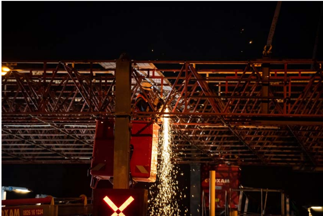
Les équipes retirent les feux d'affectation et allègent l'auvent