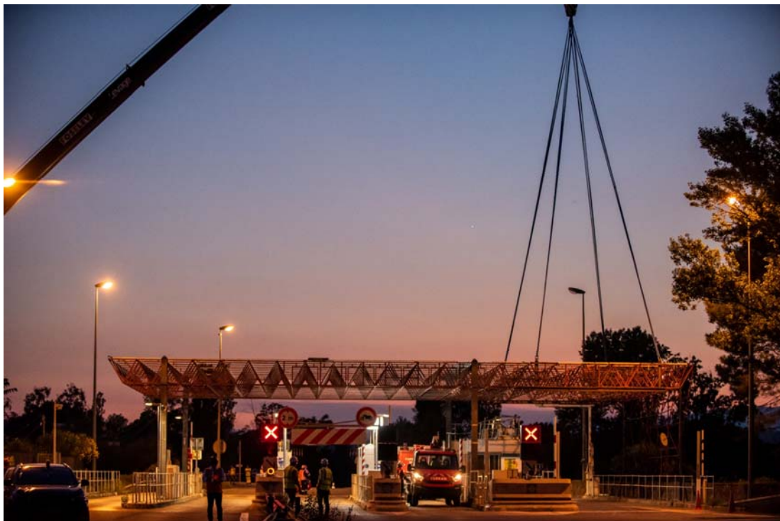
La grue de 200 tonnes retire la première partie de l'auvent