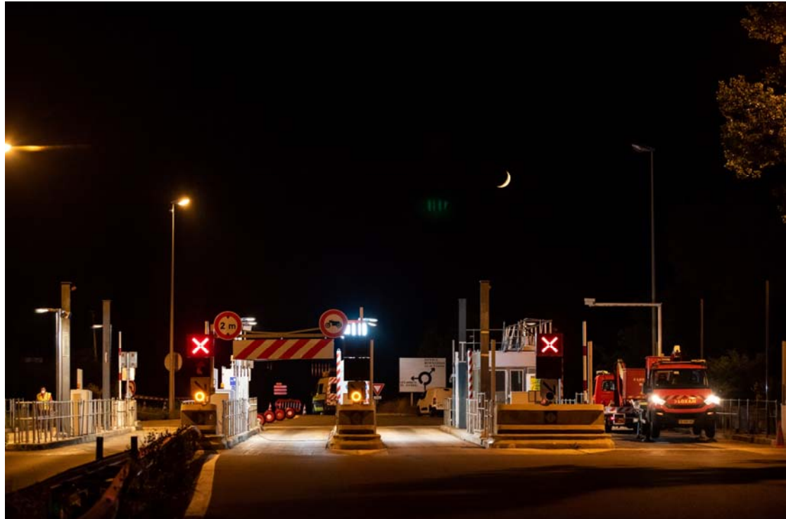
La gare de péage des Adrets (n°39) sans son auvent