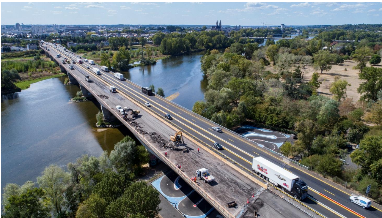
Autoroute A10 dans la traversée de Tours, les viaducs qui enjambent la Loire.

La deuxième saison des travaux se déroulera à la rentrée 2020, du 31 août au 16 octobre. Cette année les entreprises interviendront dans le sens Paris vers Bordeaux, entre les échangeurs de Vouvray-Sainte-Radegonde (n°20) et Tours-Centre (n°21).