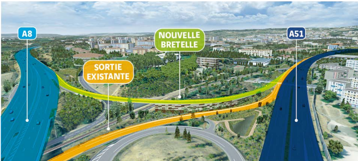
Vue virtuelle de la future bretelle

L'A51 est un axe majeur de la mobilité métropolitaine d'Aix-Marseille-Provence et joue localement un rôle de rocade pour les déplacements du quotidien en Pays d'Aix. En provenance de Gap par l'A51, la nouvelle bretelle permettra aux automobilistes de bifurquer directement sur l'A8 en direction de Lyon. Ce nouvel aménagement va améliorer les conditions de circulation dans les quartiers environnants de la commune d'Aix-en-Provence et faciliter les échanges autoroutiers entre les deux axes.