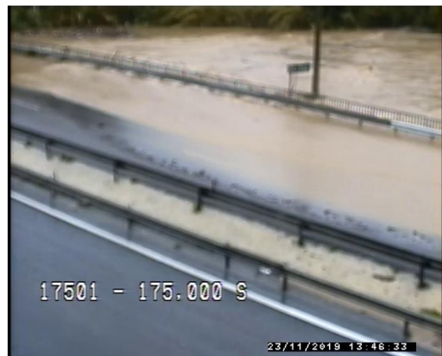
Le fleuve de la Brague

Par mesure de sécurité et compte tenu de l'évolution exceptionnelle de certains cours d'eau (les fleuves de La Siagne sur le réseau secondaire et de La Brague), un arrêté préfectoral entraine les mesures suivantes :