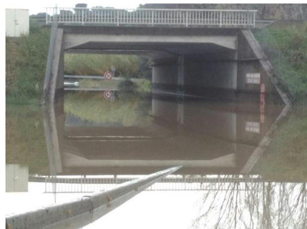
Echangeur de Mandelieu Est

Ces mesures exceptionnelles resteront activées jusqu'à nouvel ordre. Les équipes de VINCI Autoroutes se sont mobilisées toute la journée pour favoriser les réouvertures. Vers 18h30 l'échangeur de Carros (n°51.1) a ainsi pu être réouvert.