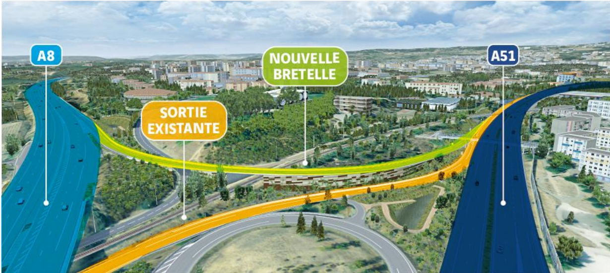
Vue virtuelle de la future bretelle - © Komenvoir

L'A51 est un axe majeur de la mobilité métropolitaine d'Aix-Marseille-Provence et joue localement un rôle de rocade pour les déplacements du quotidien en Pays d'Aix. En provenance de Gap par l'A51, la nouvelle bretelle permettra aux automobilistes de bifurquer directement sur l'A8 en direction de Lyon. Ce nouvel aménagement va améliorer les conditions de circulation dans les quartiers environnants de la commune d'Aix-en-Provence et faciliter les échanges autoroutiers entre les deux axes.