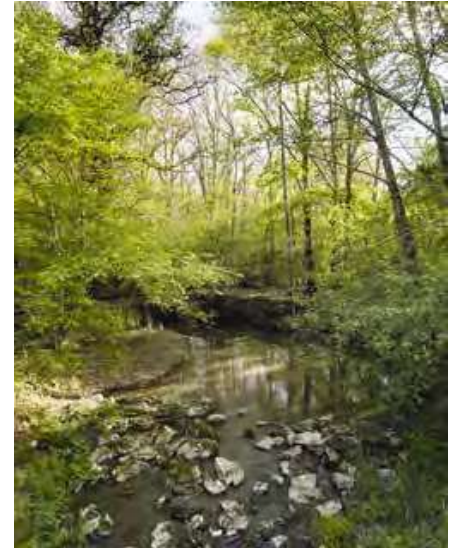
Ruisseau proche A71

Zone humide bordant l'ouest de l'infrastructure autoroutière, à hauteur de Nouan-le-Fuzelier, les étangs de Saint-Viâtre abritent une faune et une flore dont le caractère remarquable vaut au site d'être classé biotope protégé. À ce titre, le site bénéficie de mesures de conservation précautionneuses.