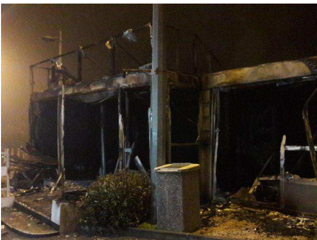
Site du Muy (A8).

VINCI Autoroutes condamne fermement ces violences et exprime sa solidarité envers ses salariés, dont la sécurité est la priorité absolue dans ce contexte de violences répétées et grandissantes. Une plainte sera déposée contre les auteurs de ces agissements inacceptables.