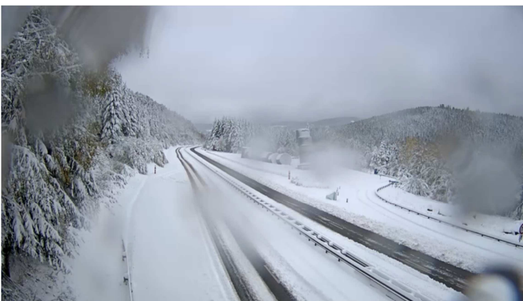
A89 aires des Suchères Secteur de Noirétable 8h30

Les opérations de dégagement des véhicules en difficultés se poursuivent, permettant à nouveau l'intervention des chasse neige et une reprise progressive de la circulation dans les zones de blocage.