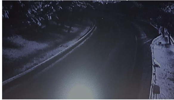
Vue vers 21h00 du secteur de la Scoperta / La Turbie (avant et après le déneigement)