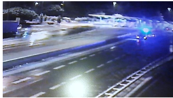
Vue vers 21h00 du déneigement du péage de la Turbie (avant et après le déneigement)

Très rapidement la perturbation s'est cependant évacuée par la mer et les autoroutes des Alpes Maritimes et du Var n'ont pas connu d'autres précipitations durant la nuit. A cette heure, la circulation sur les autoroutes est de ce fait possible sans difficulté particulière.