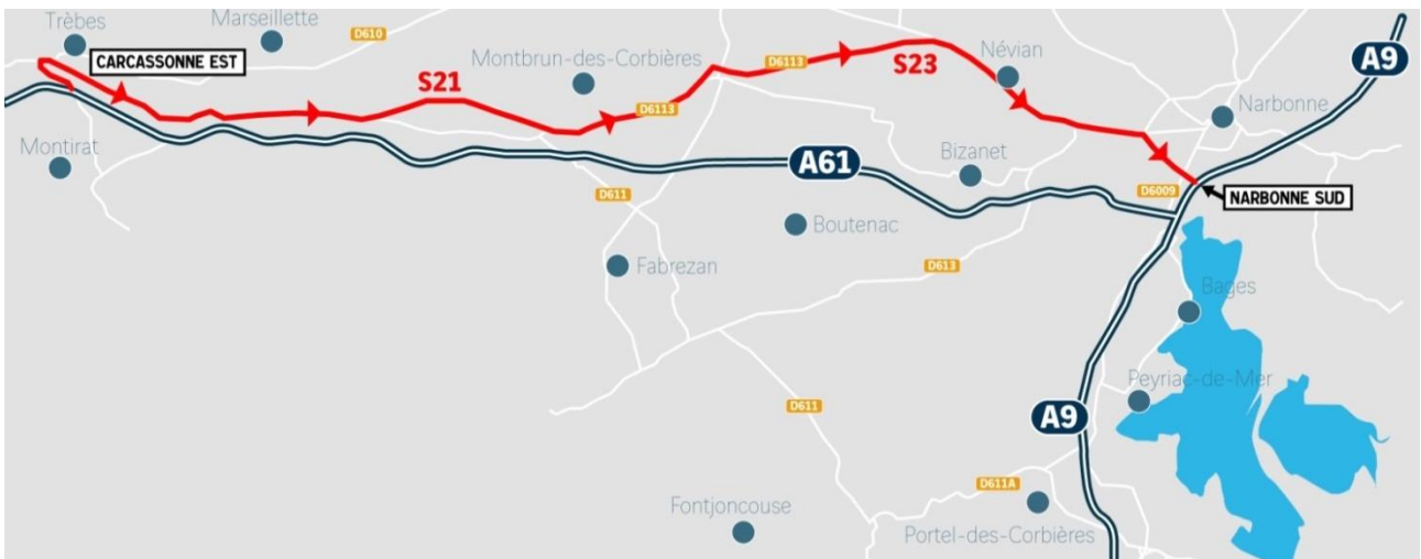
Schéma 3 :