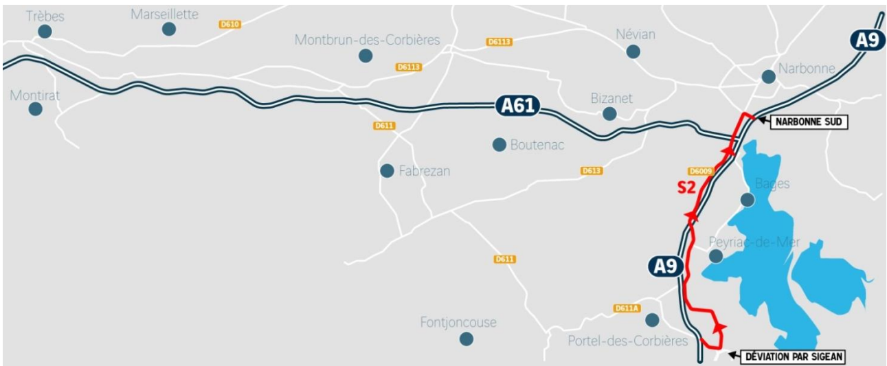
Schéma 2 :