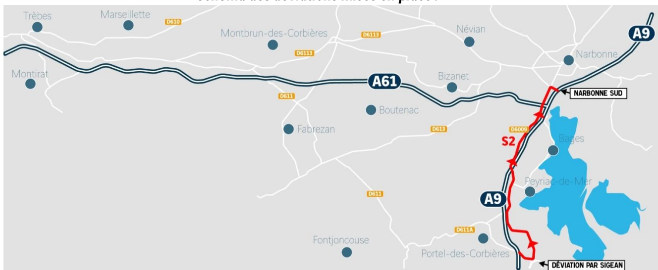
Schéma des déviations mises en place :

VINCI Autoroutes recommande à tous les conducteurs de consulter le site www.bifurcation-a9-a61.fr pour s'informer sur les dates de fermetures et sur les déviations mises en place. L'inscription aux « alertes trafic » leur sera également proposée afin d'être informés en temps réel.