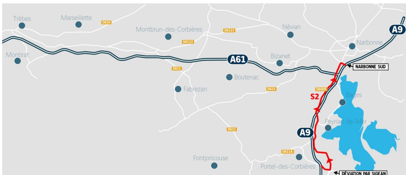
Schéma des déviations mises en place :

VINCI Autoroutes recommande à tous les conducteurs de consulter le site www.bifurcation-a9-a61.fr pour s'informer sur les dates de fermetures et sur les déviations mises en place. L'inscription aux « alertes trafic » leur sera également proposée afin d'être informés en temps réel.