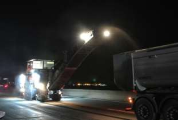
Rabotage de la chaussée

Durant ces nuits de fermeture, les travaux consisteront à restructurer la 2ème voie de circulation sur 2,2 km mais aussi à refaire le tapis roulant de l'ensemble des 4 voies de circulation et de la bande d'arrêt d'urgence sur 8,5 km.