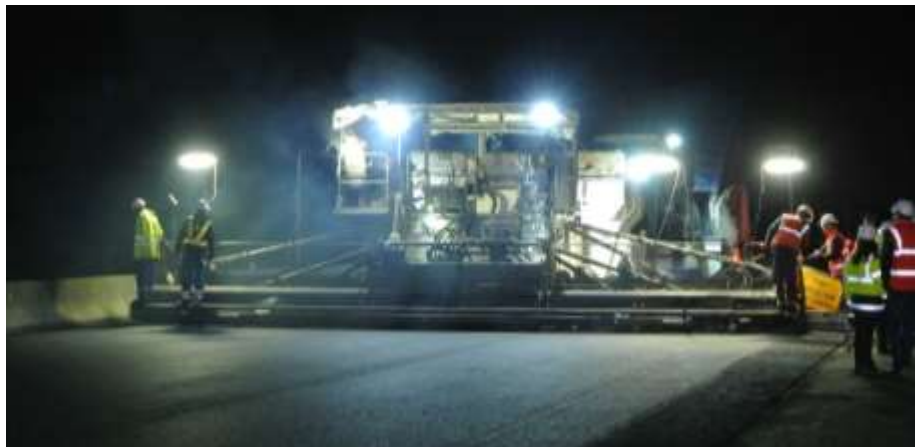
Application de l'enrobé

Ces travaux seront conduits de nuit lorsque le trafic est le plus faible afin de limiter au maximum la gêne occasionnée.