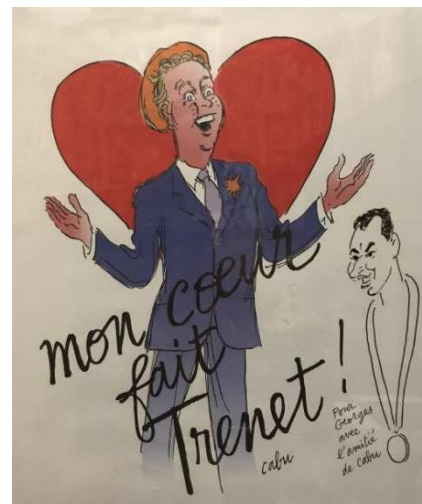
Dessin de Cabu. © Collection privée.

Les cendres du poète reposent au cimetière de l'ouest de Narbonne, auprès de sa mère, Marie-Louise.