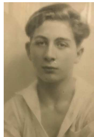
Portrait du jeune Charles Trenet

Après un rapide passage à Narbonne, il rejoint Paris au début des années 1930, et devient assistant metteur en scène et accessoiriste aux Studios de Joinville. En 1932, il s'enflamme pour le jazz, et commence à écrire des poèmes, des articles de journaux et des romans-feuilletons sous le pseudonyme de Jacques Brévin. En 1932, dans un club de jazz, il fait la connaissance d'un jeune pianiste, Johnny Hess. C'est ainsi que naît le duo "Charles et Johnny", qui allie chanson française et mélodie moderne, dans un style nouveau dit « fleur bleue », adapté du style dynamique et jeune des comédies américaines. Le duo est interrompu par l'appel de Charles Trenet sous les drapeaux en 1936.