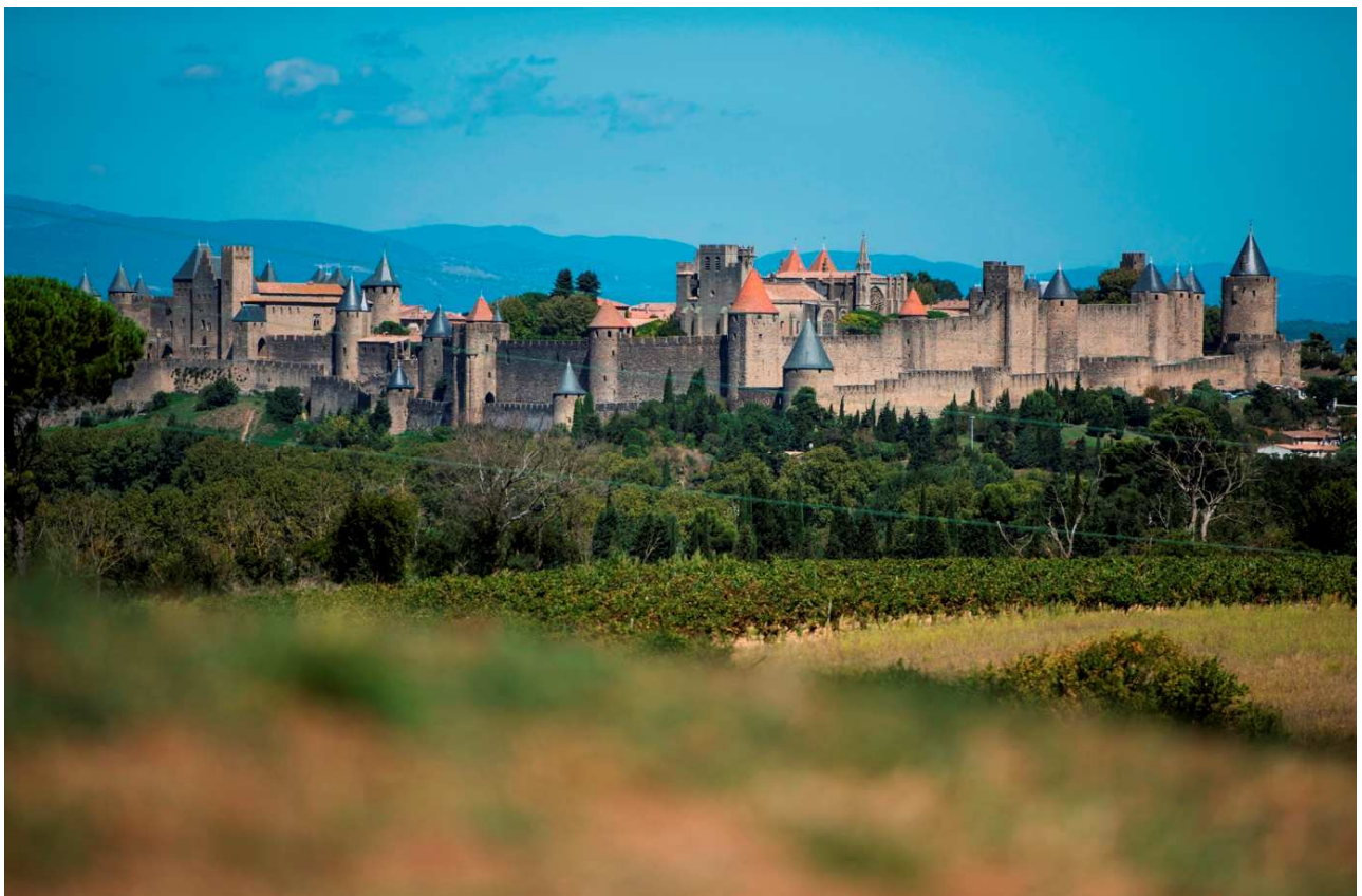
L'aire du Belvédère d'Auriac (A61) offre un point de vue exceptionnel sur la Cité de Carcassonne.

Aire de Rousset (A8) : grâce à l'exposition autour des Santons de Provence, les visiteurs peuvent découvrir les métiers de Provence et le savoir-faire des artisans de la région. Une terrasse panoramique permet d'admirer le paysage régional.